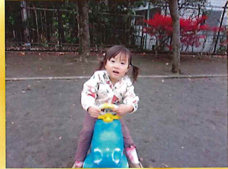
かばさん、ユラユラ楽しいね～