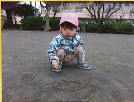
えーっと、なにかこうかな♡