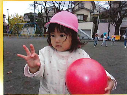
オッケー！いまなげるよ。

今日は向原第一公園に行きました。ボールを遠くまで投げようと頑張ったり、地面にアンパンマンやバイキンマンをかいて「アンパンチ！」と公園中に響き渡るくらいの大きな声をだしてみたり、今日も寒さに負けず元気に遊ぶ子ども達でした。