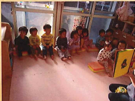
もったいないばあさんがくるよ～