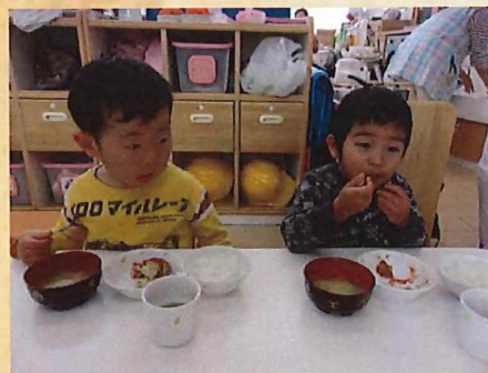
いっぱい食べるよ