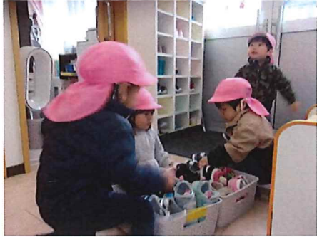
自分の靴はどれかな～☆