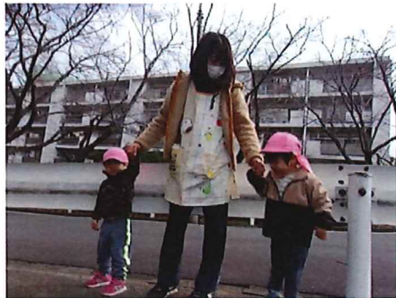
手をしっかり握ってね♪