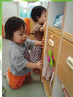
自分でつけて、こうやって...くるくる～🌀