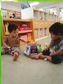
こっちの音も楽しいよ🎵