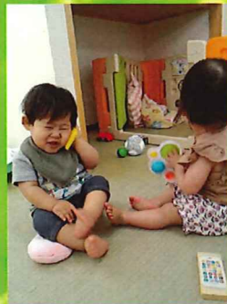
もしもし?近頃電話が忙しい📞😊