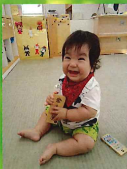
おしゃべり楽しい♥