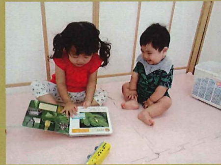
小さなお友だちに読んであげる姿も… ✨