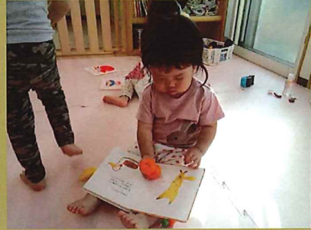
動物に食べ物をあげる優しい姿です♪