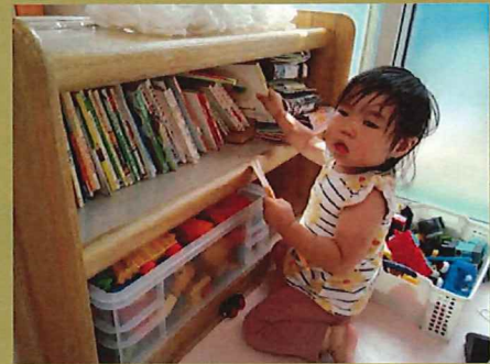
好きな絵本を選んで出しています 😊 ✨