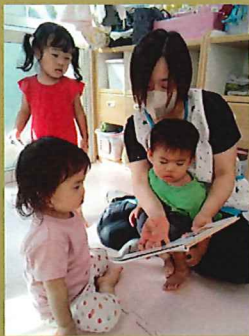
「よんで」と保育者の膝に座ります 😊 ✨