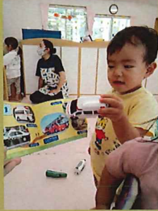
絵本と同じ玩具を持ってきて「おんなじ」と教えてくれました 🍀