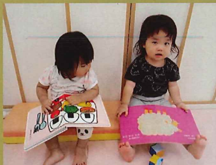
お友だちと一緒に座って読むことも…♡

自由遊びや活動の節目、午睡前など…もも組さんはとにかく「絵本」が大好き♡たくさんの絵本に触れて単語を発したり、気付きや発見を知らせてくれたりします！保育者の読み聞かせも好きで一定時間、集中して楽しんでいますよ 😊 ✨