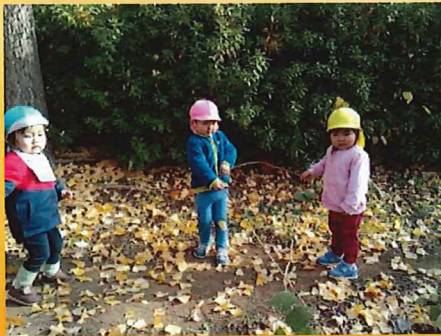
うんこしよ、どっこいしよ 🍃