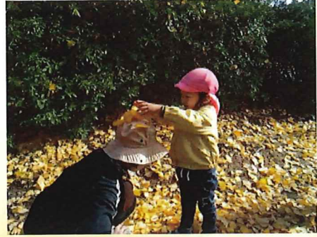
イチョウのシャワーだよ ✨