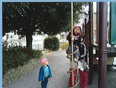
上まで登れたよー👏