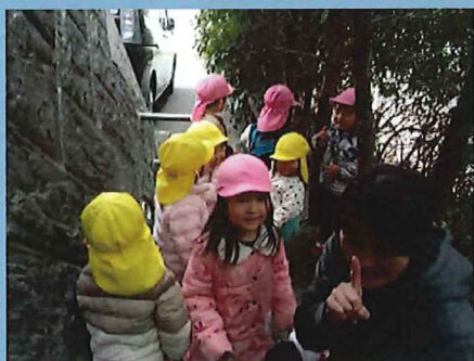
静かに隠れてるよー！