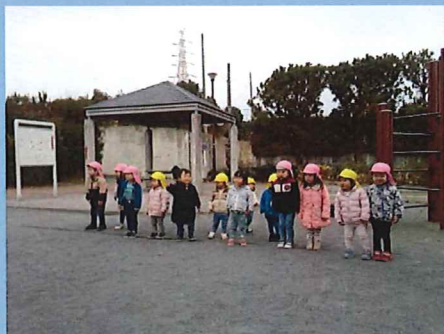
位置に着いて。よーいドン！！