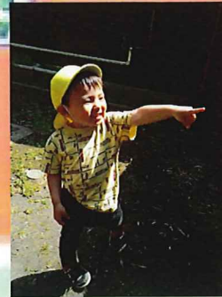
あ！あれがカッコいい🎵