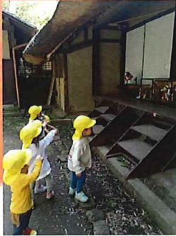
五月人形が飾ってある！