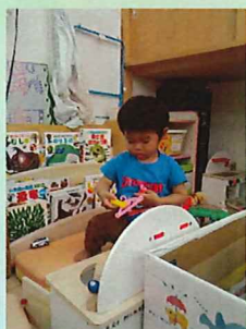
ハンガーをたくさん集めてクリーニング屋さんかな？