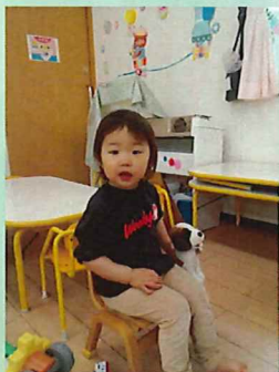
お気に入りのわんちゃんとお散歩です♪