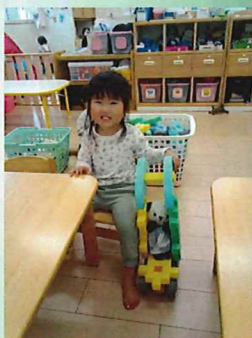
パンダちゃんをベビーカーに乗せて、ひと休み🐼