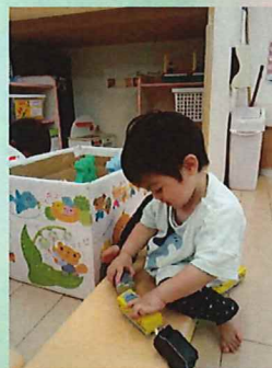
連結～💡 どんどん長くなるよ。