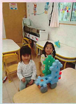
二人仲良く電車ごっこ中です🚆

今日はお散歩に出ようと思ったらパラパラと雨が…。お部屋に戻り、玄関のところでイチゴ狩りをしました🍓できていたイチゴは一粒だったので、調理の先生に「お願いしまーす」と渡し、7等分してもらいお給食の時間に食べました。ほんの一口でしたが、「甘い♥️」と嬉しそうな子どもたちでした。その後はお部屋でじっくり遊びました。一人が電車ごっこを始めると「乗せてくださーい」とどんどんお客さんが増えていましたよ。