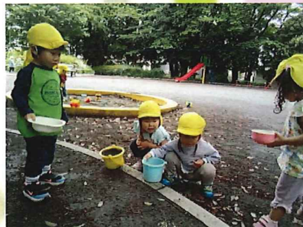
ここにいっぱいいるよ！！