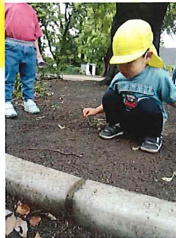
わあ！ミミズが動いた！！