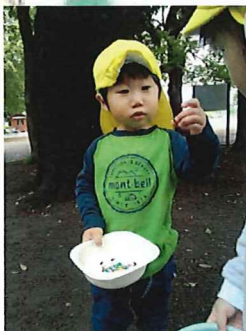
これが一番大きいかな ♡