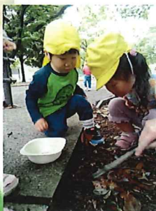
ダンゴムシは葉っぱの下だって。先生は枝でやるよ(まねっこ)