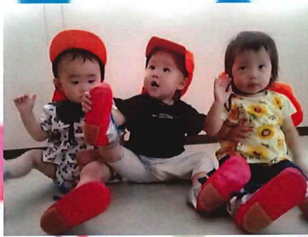
避難訓練も楽しいね！

今日はお部屋で片栗粉に触って遊びました。初めての感触に嫌がらずつまんでみたり、混ぜてみたり・・・その後、シャワーもして、汗と片栗粉を落としてきれいさっぱりの一いちごぐみさんです。避難訓練では避難帽と靴を履くと、気にいって、脱ぎたくない！といった様子でした。