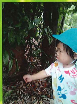
ぬけ殻取ってみよう…