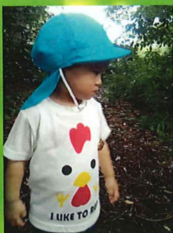
服につけてみたよ！