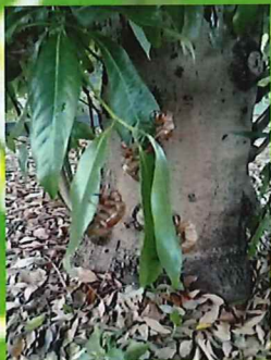
セミのぬけ殻いっぱい…！