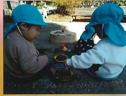
ハッピーバースデー🍰 おいしーね！！

小金第2公園に行ってきました！カラカラを引っ張りながらお友達と追いかけてごっこを楽しむ姿やどんぐりや葉っぱでデコレーションしたケーキを作りお友達に「食べに来て！」と声を掛け一緒に食べる真似をしたりとお友達同士で遊ぶ姿が見られるようになってきたもも組さんです。