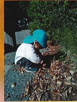
葉っぱを小さくちぎると音がするね～😊