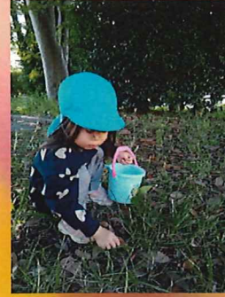
どんぐりどこかなあ～🍄