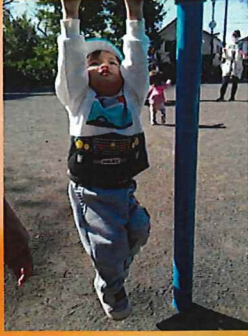
みてみて！ぶらぶらできるよ～💪