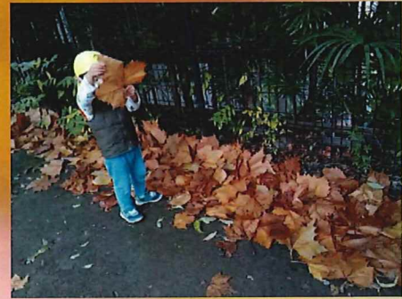
大～きい葉っぱ見つけたよ 🍁 だーれだ ✨