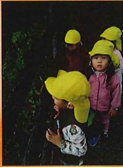
見て！クモがいっぱいいる ☁️