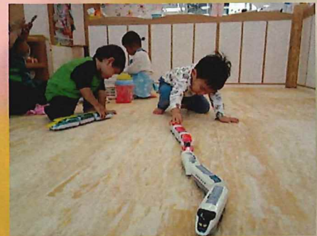
新幹線が通りまーす 🚅