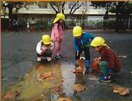
水に入っちゃダメだけど、やっぱり気になる…