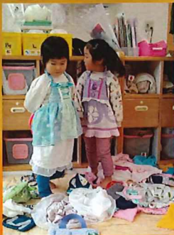
この服はどうかしら ✨？

向原第一公園に向かいながら、たくさんのクモを発見して、クモの足は何本あるの？靴は履いてる？わー！すぐ近くにいた 🌧️ と、おしゃべりも元気いっぱい。公園でも、大きな落ち葉や水たまりに嬉しそうなめろん組さんです。でも残念、ポツポツと雨が降り出したので、早々に園に戻ってくることに。濡れなくて良かったね 😊 と話しながら、室内でもゆったりと好きな遊びを楽しみました。