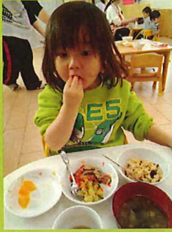
オレンジおいしい 🍊