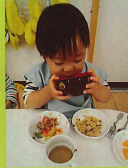
お椀持ってゴクゴク