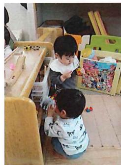
ブロック楽しいね♡

ご入園、ご進級おめでとうございます🌟新しいお友だちが2人増えて6人でスタートするもも組さん♡これからたくさん遊んで毎日楽しく過ごしていきたいと思います😊 よろしくお願いたします🎵