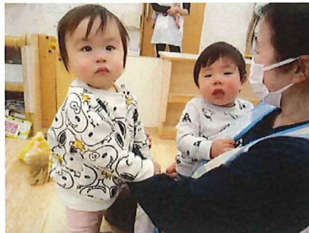
きらきら星の歌に合わせて手を動かしています★