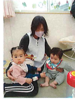
ここがいちご組かぁ🍓