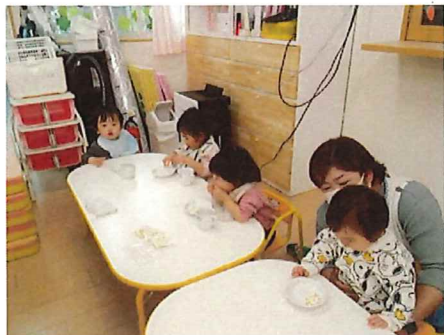
朝おやつ、おいしいね😊