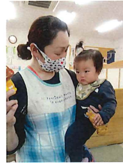
ちょっと寝たら玩具も気になってきた♪

ご入園おめでとうございます。雨の中、大きな荷物と共に初めての登園。お家の方と離れることも、初めての保育者もお部屋も、不安でいっぱいです。涙だって出ちゃうのです😭しばらくはそんな姿が続き、心苦しさもあるかと思いますが、それぞれのペースで慣れていき、好きな遊びを見つけて、楽しい時間を過ごしていこうと思います。これから一年間よろしく願いいたします。