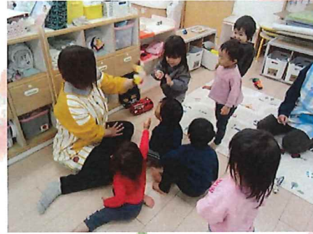
食いしん坊ゴリラにご飯をあげよう