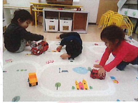
消防車が通ります