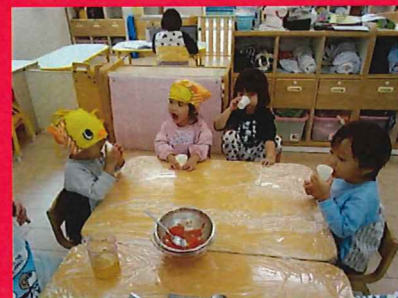
トマトやりんごジュースの試食・試飲「うん！おいしい♡」「トマトのあじー」