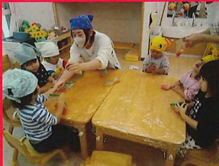
湯むきしたトマトを袋に入れてつぶしてみよう！