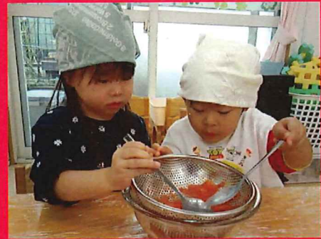
次は裏ごしするよ 🍅 ✨