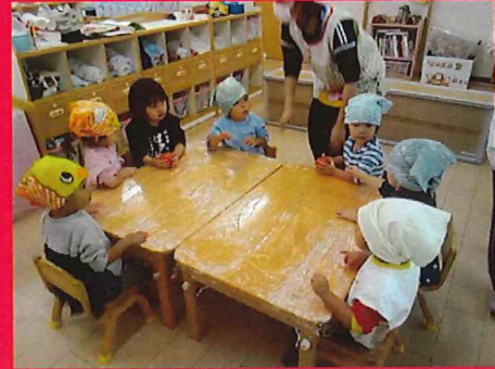
さわって…においをかいで…「トマトだ！！」