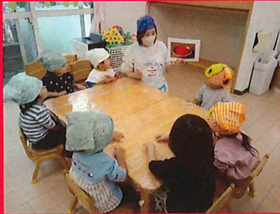
ゼリー作りをするよ。これはなんだろう？「いちご？」「りんご？」「トマト？」