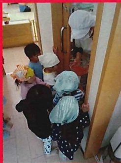
できました！ゼリーにしてください♡

夏に愛情たっぷりお世話をした夏野菜の一つ「とまと🍅」猛暑で思った以上の収穫が出来ず残念でしたが…今日トマトを使ったクッキングを行いました♡トマトに触れる体験をして気づきや発見があり、一つひとつの工程に興味を示し「やってみたい」と意欲的なめろん組さん♡試食や試飲もしながら楽しく取り組んでいました。